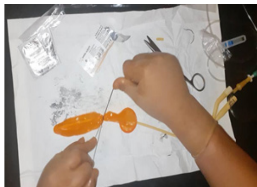
Figura 3. Procedimiento para realizar el balón artesanal con condón. Se realiza la sujeción del condón a la sonda con sutura de seda.