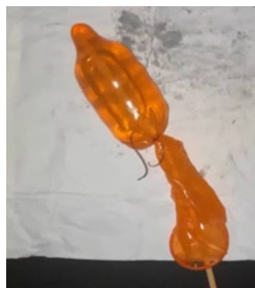
Figura 4. Balón artesanal con condón llenado con solución fisiológica.