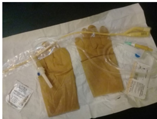
Figura 2. Materiales para confeccionar un balón artesanal con condón.

Se consideró falla del TUB cuando pasados 15 minutos,