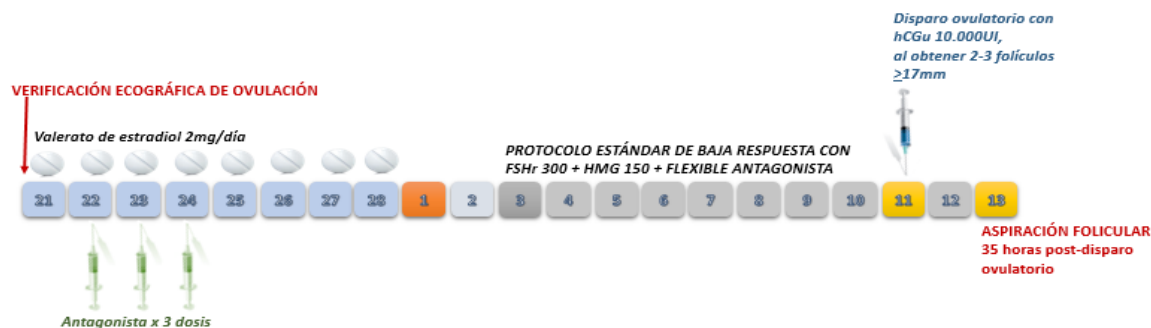
Figura 3. Protocolo con priming de estradiol.