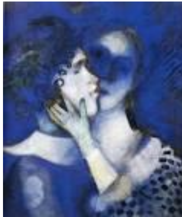
“Blue lovers” Marc Chagall