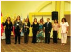
Juramentación de Miembros